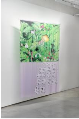
Morningside Park Snail , 2023, Cotone e seta stampati digitalmente, 241 × 175 cm

Fiera Internazionale di Arte Moderna e Contemporanea